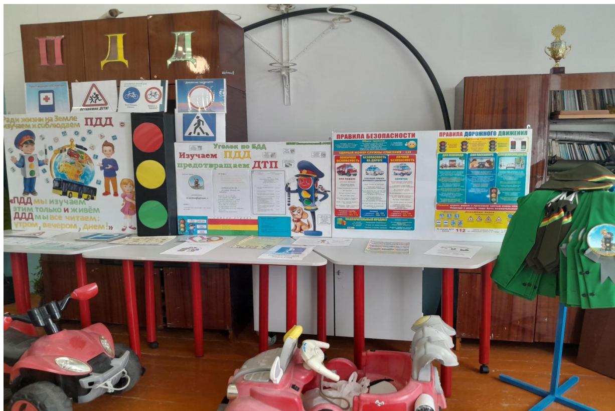
Наличие уголков по безопасности дорожного движения в классах